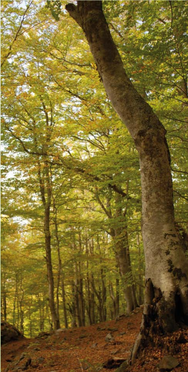
Die Rotbuche ( Fagus sylvatica ) ist ein bedeutender Forstbaum. Sie wird für 26 HKG nach FoVG angeboten.