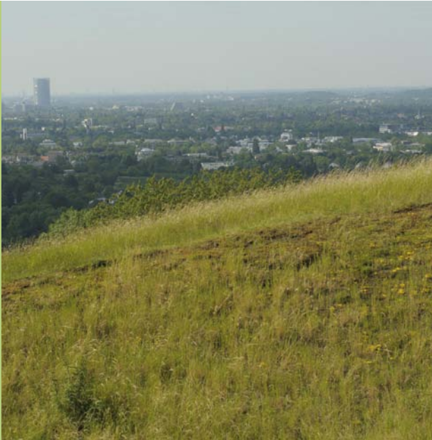
Naturschutzgebiet im Ballungsraum - die „freie Natur“ beginnt gleich außerhalb des besiedelten Bereichs.