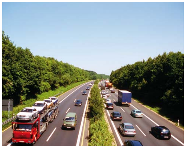
Gehölze an Verkehrswegen haben mit Extremen zu kämpfen.

Auch im Straßenbegleitgrün sollten in keinem Fall gebietsfremde invasive Gehölze verwendet werden. Nicht verwendet werden sollten gebietsfremde Herkünfte, wenn in unmittelbarer Nähe besonders schutzwürdige Bestände derselben Art (zum Beispiel ausgewiesene Generhaltungsbestände der Forstwirtschaft; Bestände in Naturschutzgebieten oder deren unmittelbaren Nähe) stehen. Von der Pflanzung gebietsfremder Herkünfte bei angrenzenden naturschutzrechtlich geschützten Gebieten (Natura-2000-Gebiete, Naturschutzgebiete) sollte auch bei Straßenbegleitgrün grundsätzlich abgesehen werden.