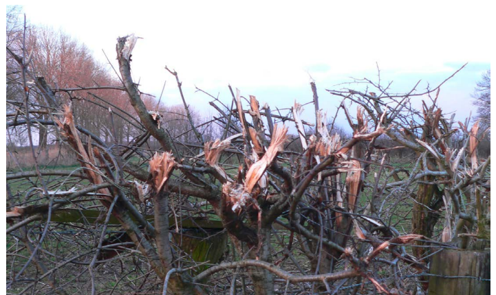
Ein sauberer, leicht schräger Schnitt wie im linken Bild sorgt dafür, dass Feuchtigkeit von den Stümpfen abfließen kann. Werden die Gehölze dagegen mit einem Häcksler eingekürzt, sind die Schnittstellen zerfranst und faulen leicht bei eindringender Feuchtigkeit.