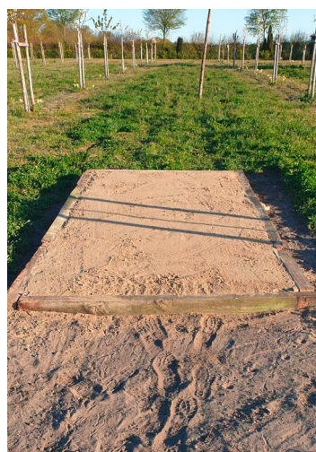
Ein Sandbeet ist schnell angelegt und stellt einen wertvollen Brutraum für Wildbienen dar.

Greifvögel sind gute Mäusefänger und sollten auf Streuobstwiesen unterstützt werden. Gerade bei jungen Obstbäumen ist es sinnvoll Greifvogelstangen aufzustellen, damit sich die Vögel nicht in die jungen Bäume setzen. Die dünnen Äste würden unter der Last der Vögel abbrechen. Für den Ansitz sollen die Querstangen über Kreuz genagelt werden. So können sich die Vögel leichter umdrehen und haben einen besseren Rundumblick.