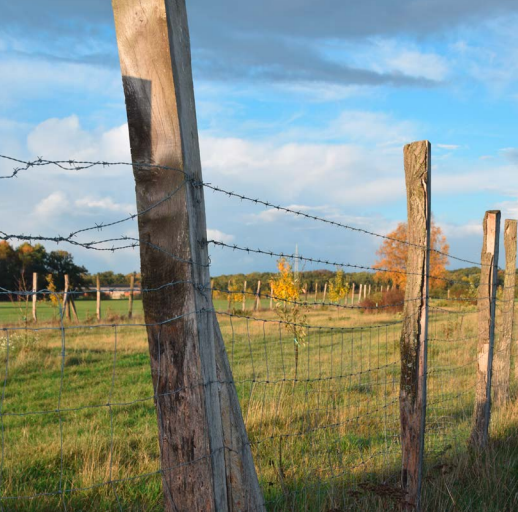
In den Ritzen und Löchern von Eichenspaltholzpfehlen fühlen sich Insekten wohl.