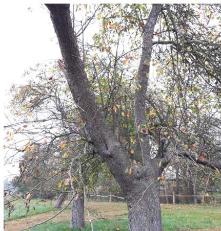
Ein alter Baum mit vielen Astlöchern bietet Nist- und Unterschlupfmöglichkeiten für viele verschiedene Tierarten.