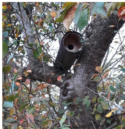
Der Steinkauz ist eine Leitart der Streuobstwiesen, da er sich hier sehr wohlfühlt. In Niedersachsen ist er vom Aussterben bedroht. Mit Nisthilfen kann dem Steinkauz – da wo er noch vorkommt – gut geholfen werden.