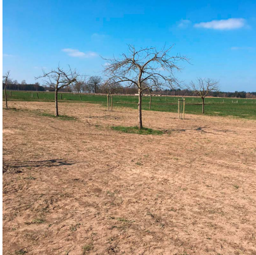
Für die Einsaat einer bunt blühenden Wiese mit heimischen Wildkräutern benötigt es eine sorgfältige Vorbereitung und Bearbeitung der Wiese.