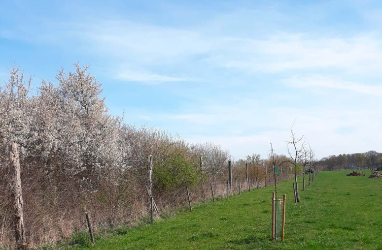
Im Frühjahr bietet die Hecke mit ihren unterschiedlichen Blühzeitpunkten eine zusätzliche Nahrungsquelle für Insekten. Im Herbst können sich Vögel von den Früchten ernähren.