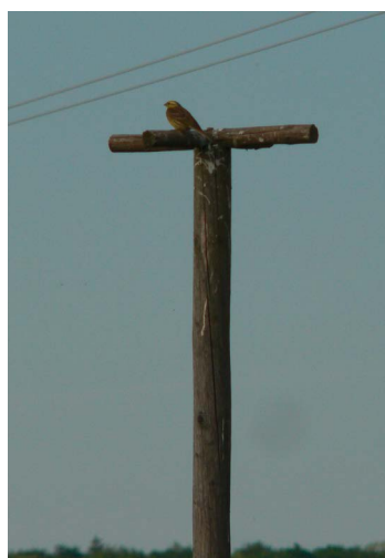
Die Greifvogelsitzstange nutzen auch andere Vögel wie die Goldammer gerne.