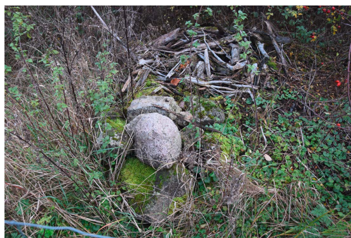
Ast- und Steinhaufen sind schnell und einfach angelegt und werden gerne von Mauswiesel als Nist- und Versteckmöglichkeit angenommen.

Trockensteinmauern – das sind Mauern, die ohne Mörtel aufgebaut sind – und Steinhaufen bieten an einem sonnigen Standort wärmeliebenden Tieren einen wichtigen „Aufwärmplatz“. Eidechsen und Schmetterlinge nutzen die Wärme der Steine, um ihre Körpertemperatur zu regulieren. Zwischen den Steinen legen Hummeln und andere Wildbienen ihre Nester an. Molche und Kröten können im Steinhaufen sicher überwintern. Sind die Räume zwischen den Steinen groß genug, kann sich auch ein Mauswiesel ansiedeln. Selbst in einem Haufen kleiner Steine wie Schotter finden noch Spinnen ihren Lebensraum.